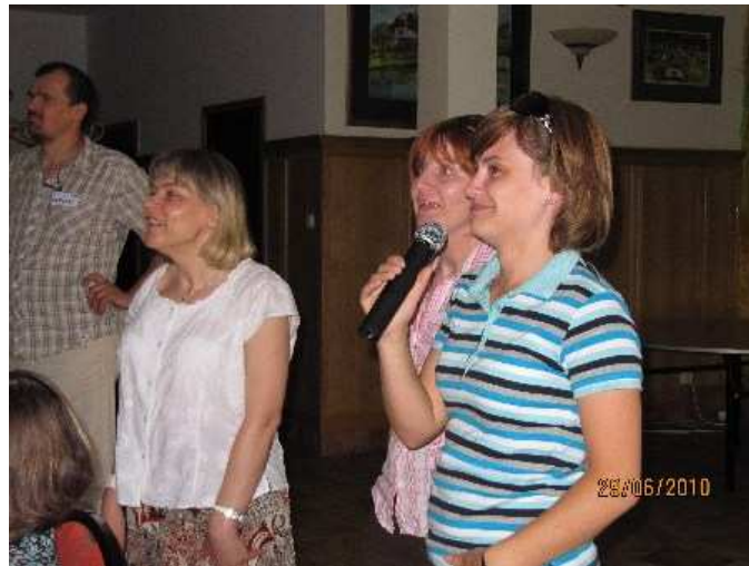
Po zajęciach śpiewamy karaoke