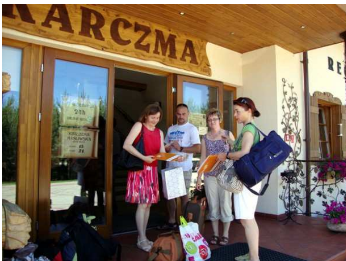
Tu jemy obiady i tu jest recepcja