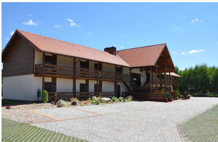
Tu są kameralne sale zajęć