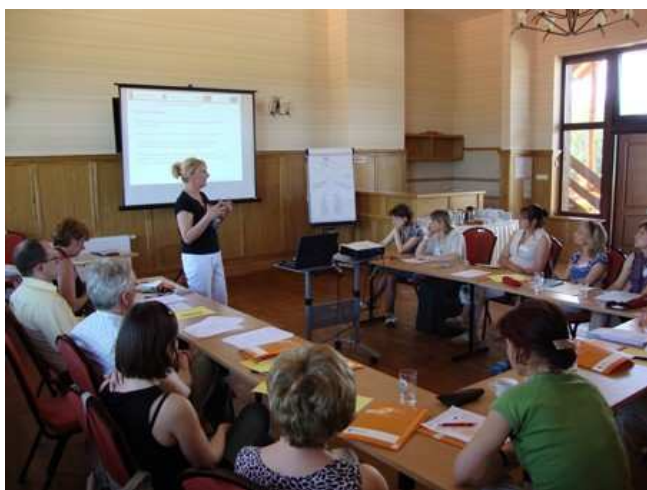
Zajęcia - biologia