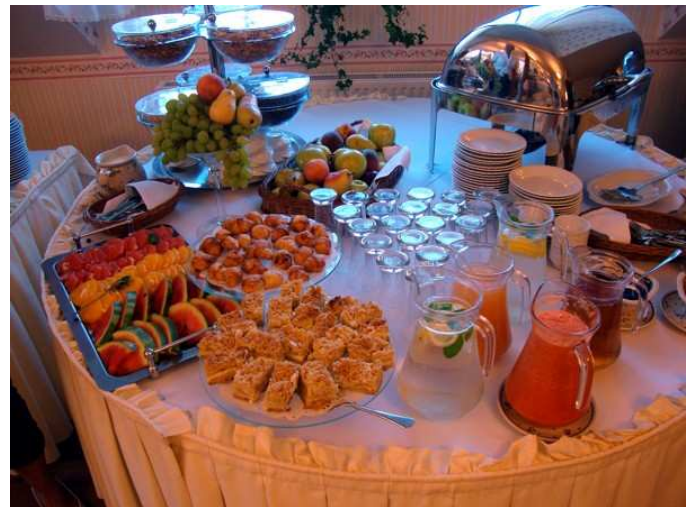
Estetyka przygotowania niebywała