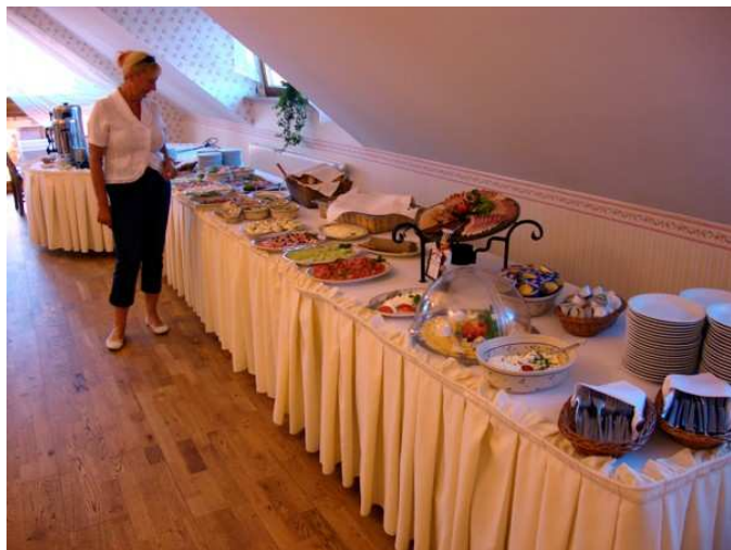
Tu spożywamy śniadania i kolacje